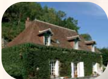
Manoir XVII e